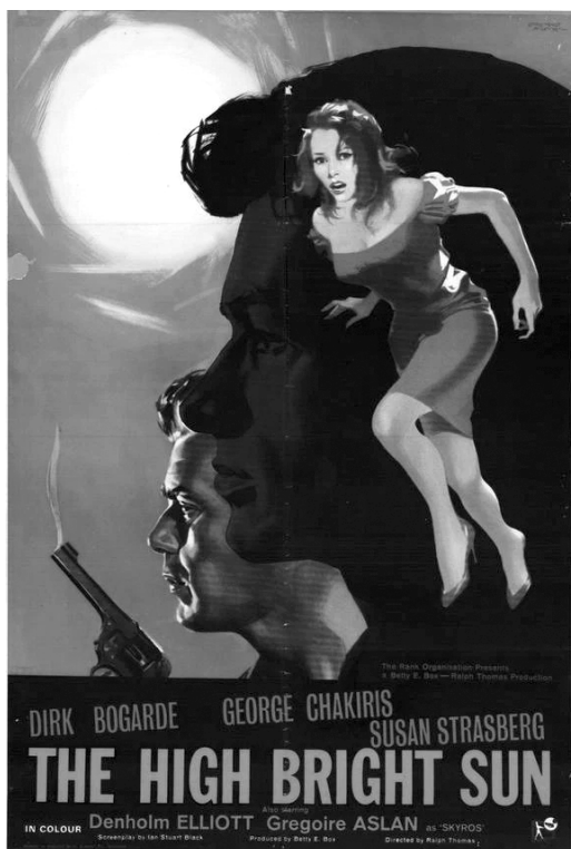
Постер фильма «Солнце в зените»

В 1965 году на мировые экраны вышел британский блокбастер «Солнце в зените» ( The High Bright Sun ). Картина стала самым дорогостоящим проектом в карьере режиссера Ральфа Томаса и продюсера Бетти Бокс и заняла особое место в истории британского кино, обратившись к теме кипрских событий середины XX века.