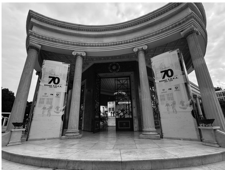
Выставка «70 лет ЭОКА 1955–1959», 2025 год. Никосия

в 2025 году в здании бывшего муниципалитета в бастионе Д'Авила в Никосии прошла выставка «70 лет ЭОКА 1955–1959», организованная Управлением прессы и информации совместно с Фондом радио Кипра (CRF). Торжественное открытие выставки провел президент Республики Никос Христулидис. На выставке были представлены аудиовизуальные материалы Фонда радио Кипра (CRF), которые рассказывают историю борьбы посредством подлинных архивных документов, а также документальный фильм «Λεύτερες» («Свобода»), представляющий борьбу ЭОКА глазами женщин-бойцов.