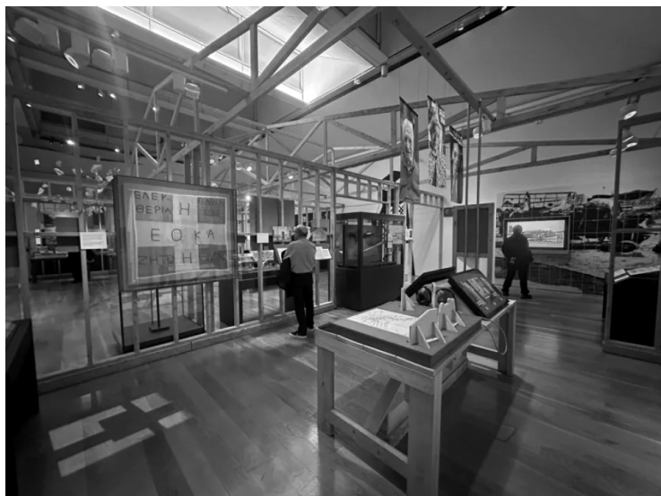
Экспозиция «Чрезвычайные выходы: борьба за независимость в Малайе, Кении и на Кипре», 2025 год. Лондон