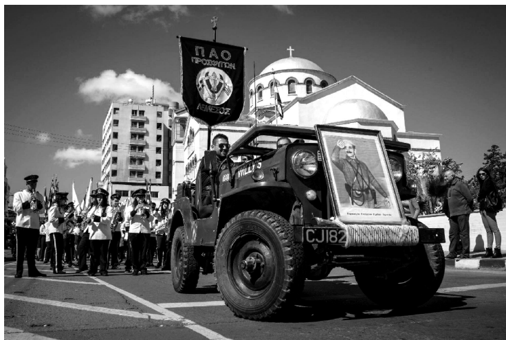
Национальная панихида в память о Георгиосе Гривасе 22 января 2023 года. Лимассол

Гриваса, отмечаемый в последнее воскресенье января, и в День начала Освободительной борьбы 1 апреля — сотни людей собираются, чтобы почтить память павших и выразить уважение героям того времени.